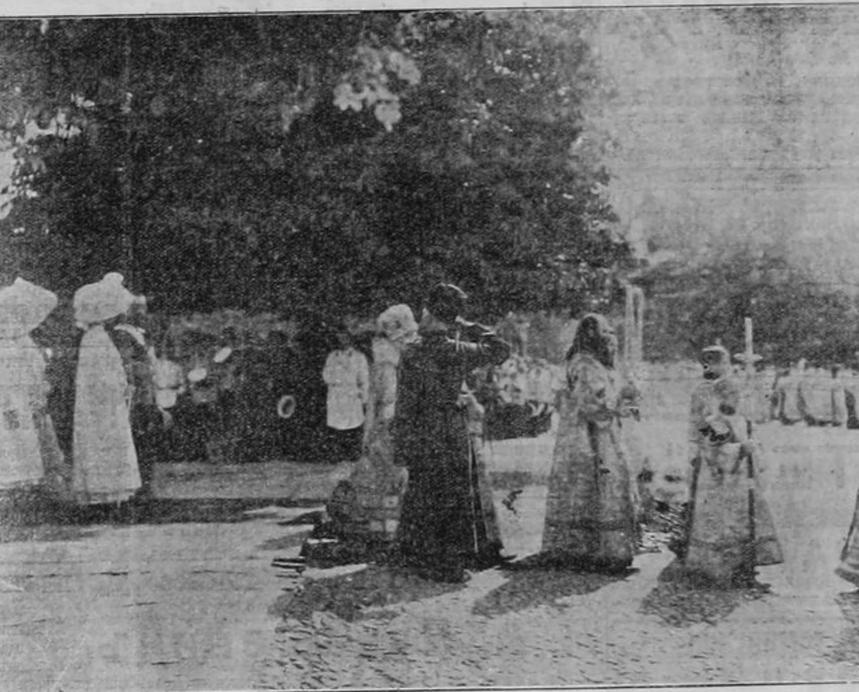
Крестный ходъ къ памятнику Царя-Освободителя.